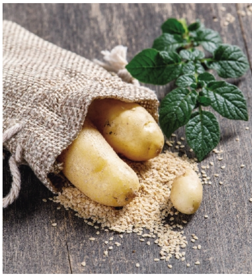
杂交马铃薯的块茎和种子。

2011 年在《自然》发表全球第一个马铃薯参考基因组；2018 年在《自然-植物》上宣布打破马铃薯自交不亲和；2019 年在《自然-遗传》发表论文，解析了马铃薯自交衰退的遗传基础；2020 年到 2022 年，探索了二倍体和四倍体马铃薯基因组中有害突变的分布模式；2021 年在《细胞》发表第一代高纯度自交系材料；2022 年《自然》发表马铃薯泛基因组，并发现薯块发育的身份基因；2023 年在《细胞》上宣布开发了“进