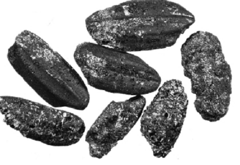
李家岗遗址灰坑中浮选出的碳化稻米。

经考古发掘，考古人员初步探明两处古稻田分别位于南、北壕沟附近，北部古稻田揭露面积较大，在北壕沟内、外两侧均有分布。考古人员在剖面及平面系统采集土样进行水稻植硅体浓度的检测分析，显示多数土样含量超过